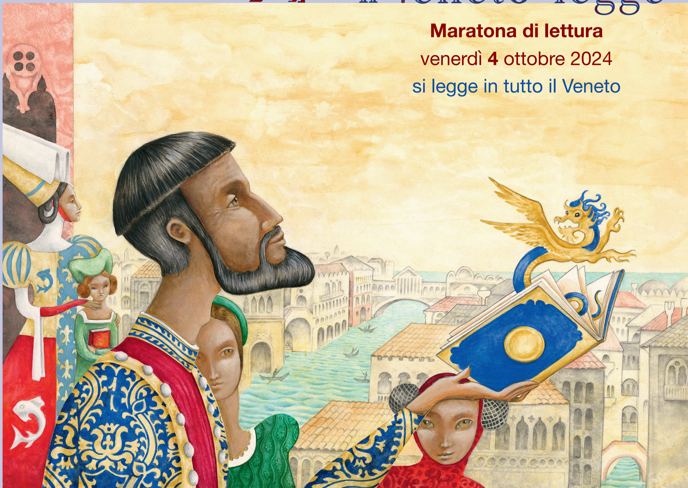
Illustrazione di Michelangelo Rossato tratta dal libro "Marco Polo" edizioni AFKA 2024

Maratona di lettura venerdì 4 ottobre 2024 si legge in tutto il Veneto